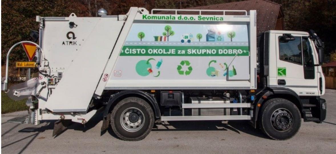
URNIK ODVOZA KOMUNALNIH ODPADKOV OD 1. 1. - 31. 12. 2019